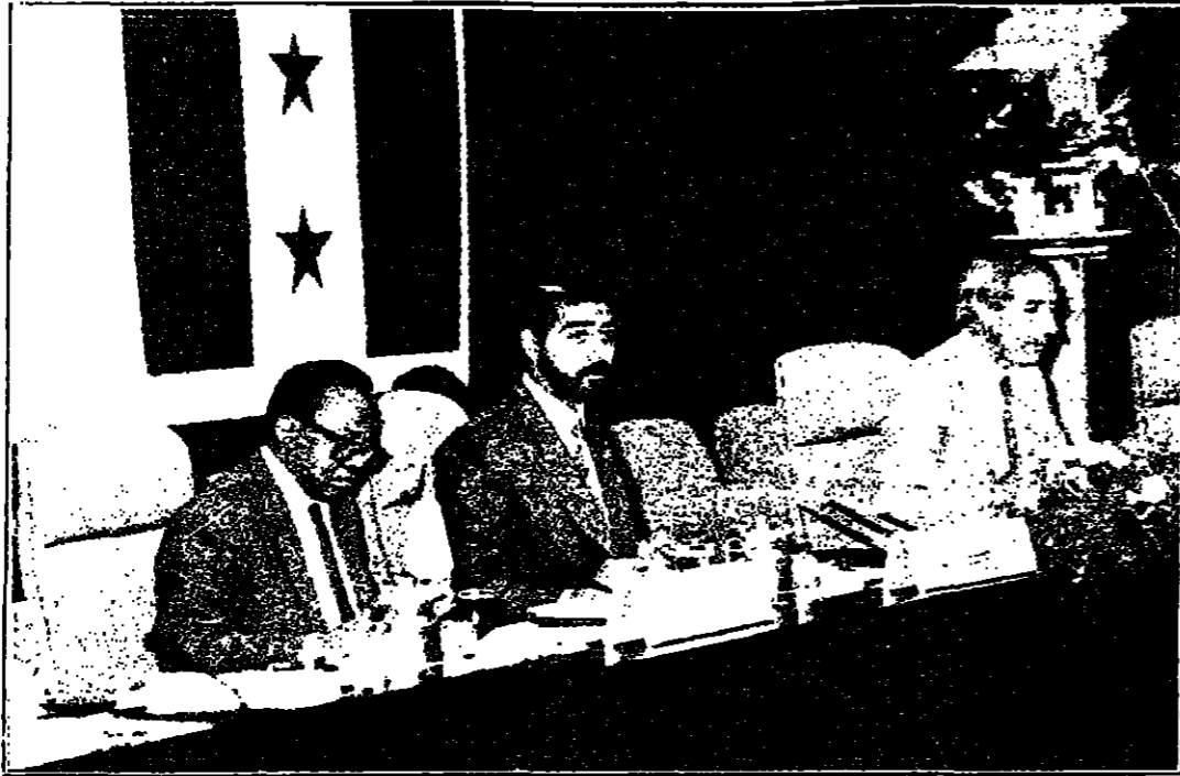
اختتمت في بغداد امس اجتماعات الدورة العشرين للمكتب التنفيذي لمجلس وزراء الشباب والرياضة العرب بعد ان استمرت يومين وصالح المكتب التنفيذي في الجلسة الختامية التي عقدها برئاسة السيد عدي صدام حسين رئيس المكتب على التوصيات التي اقروها واسترفع الى اجتماعات مجلس وزراء الشباب والرياضة العرب في دورته الحادية عشرة التي ستبدأ في بغداد اليوم للمصالحات عليها.

عربي وهو يشهد الفصل البيطري العراقي في مواجهة اعداء الامة ويمس حجم الخيبة التي اصابت النظام الايراني الصهيوني والقوى المتعاطفة معه في الضغط والابتزاز على الحظر الخليج العربي الشقيقة في ذات الوقت الذي تتصاعد فيه مقاومة شعبيتنا الفلسطينية بكل الوسائل واساليب البطش والارهاب الصهيوني.