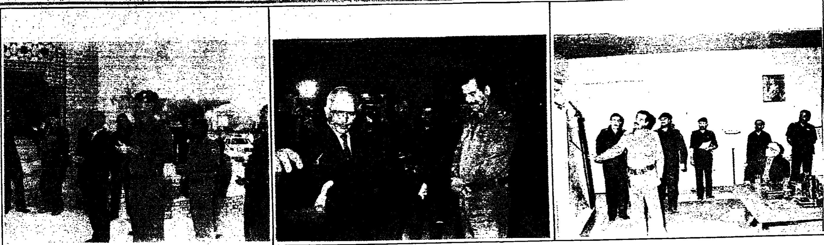
لقطات من استقبال الرئيس القائد صدام حسين لأخيه جلاله الملك حسين والمباحثات الاخوية العراقية - الاردنية